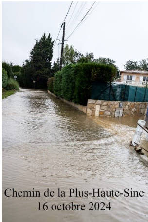
Chemin de la Plus-Haute-Sine 16 octobre 2024

Les épisodes méditerranéens récents sur notre pays, notre région, ville et quartier nous rappellent une fois de plus à quel point nos modes de vie et les décisions d'aménagements des territoires influent sur les conséquences de ces déchainements climatiques.